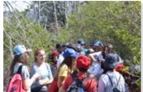
שבט פסגה 2014